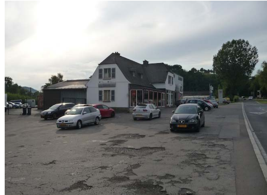
(1) Blick nach Nordwesten Seat-Werkstatt