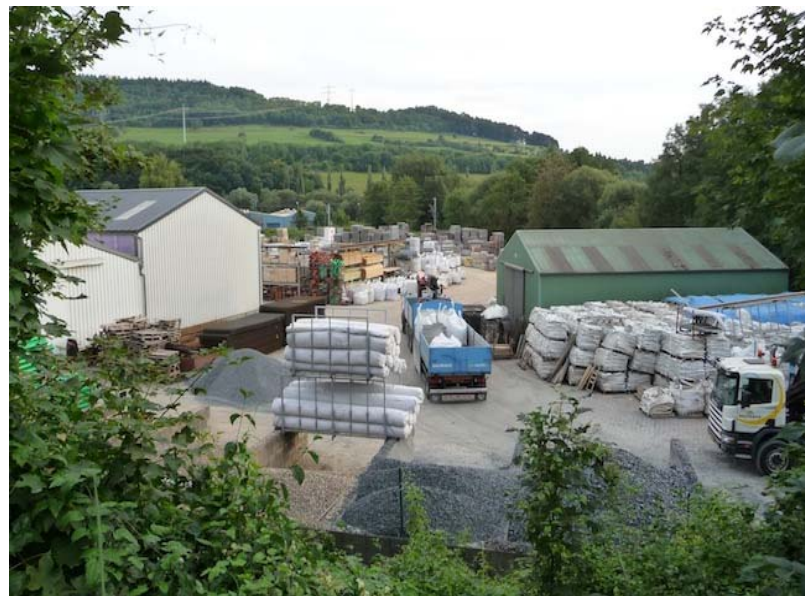
(2) Blick nach Süden - Lager