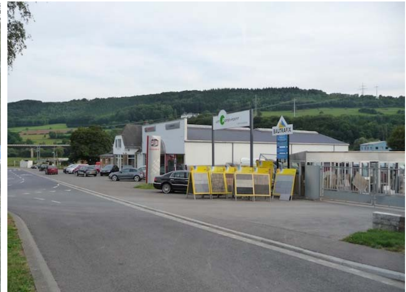
(3) Blick nach Südosten