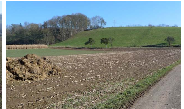
(4) Mittlerer Teil der Fläche Östlich steigt die Fläche zur B7 an