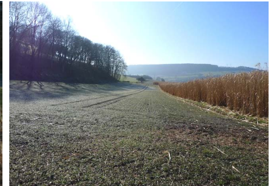
(2) Blick Richtung Süden Das Plangebiet ist nach Osten eingegrünt