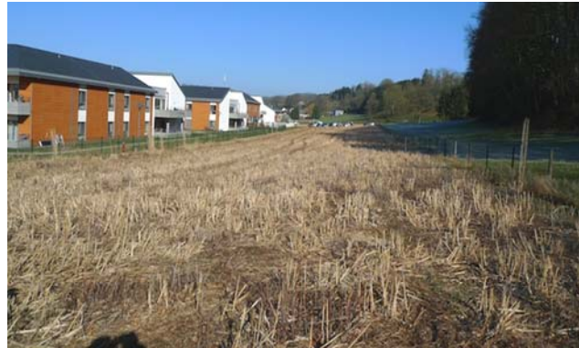
(1) Blick auf den nördlichen Bereich der Fläche Im Westen grenzt das Alzheimer Zentrum an