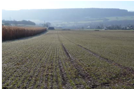
(3) Ebene Ackerflächen östlich der Ortschaft Erpeldange