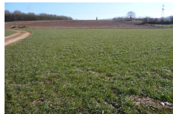
(5) Südlicher Teil der Fläche