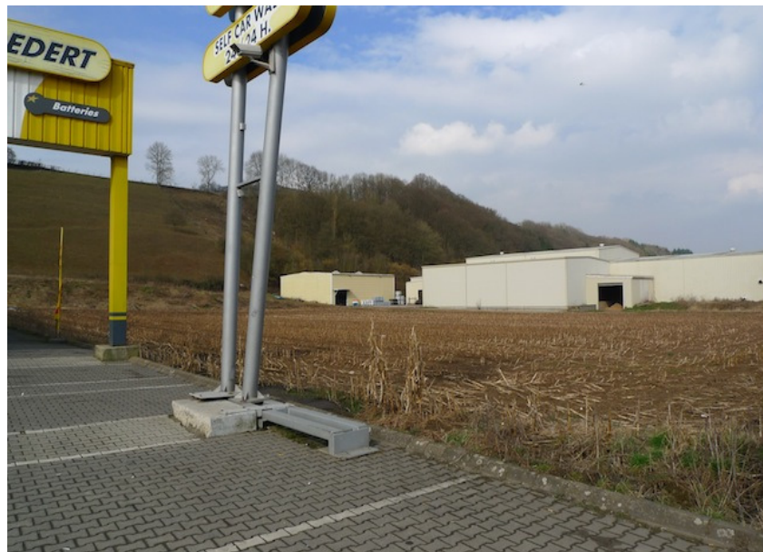
(2) Blick nach Norden Das Gelände reicht bis an die Böschung des Goldknapp heran