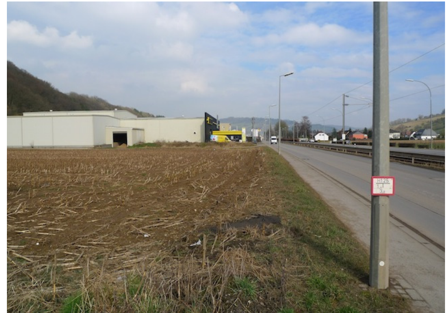
an der Straße