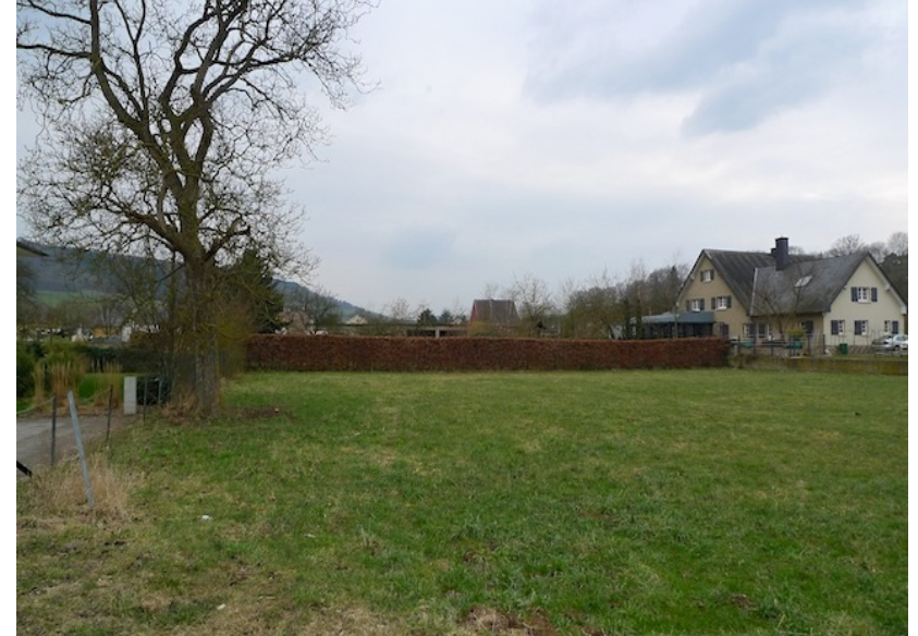
(1) Blick nach Westen Bäume und Hecken