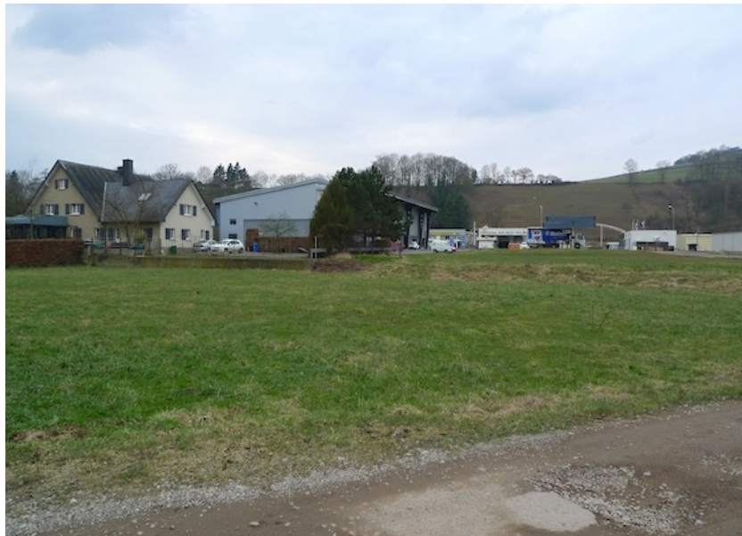
(2) Blick nach Nordwesten Restfläche in Nachbarschaft von Wohnen und Gewerbe