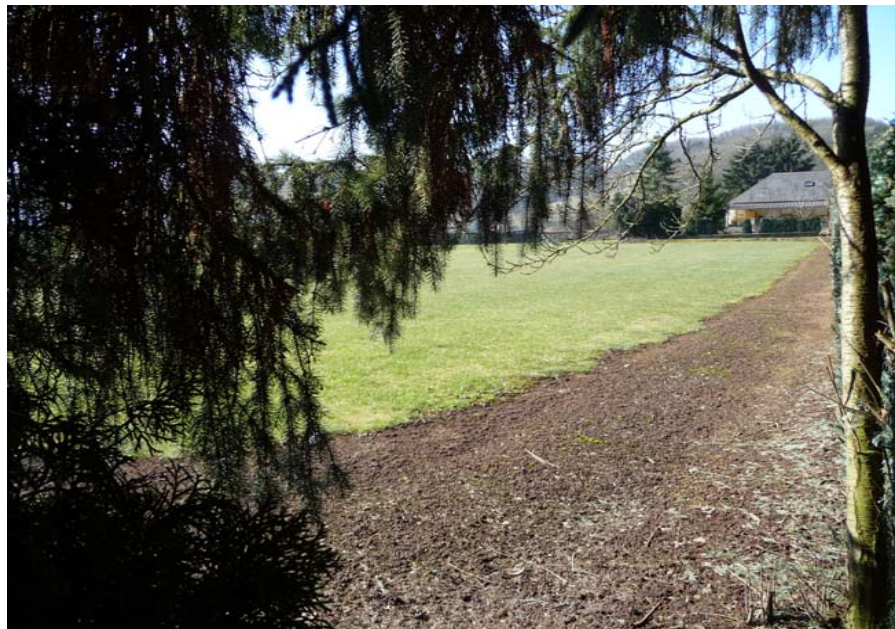
(2) Blick auf den westlichen Bereich der Fläche im Mittelteil