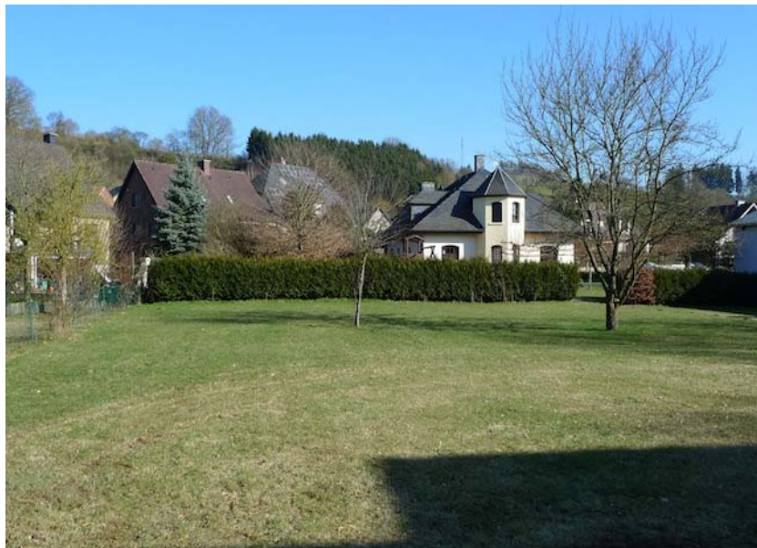
(2) Freifläche in der dritten Reihe der Porte des Ardennes