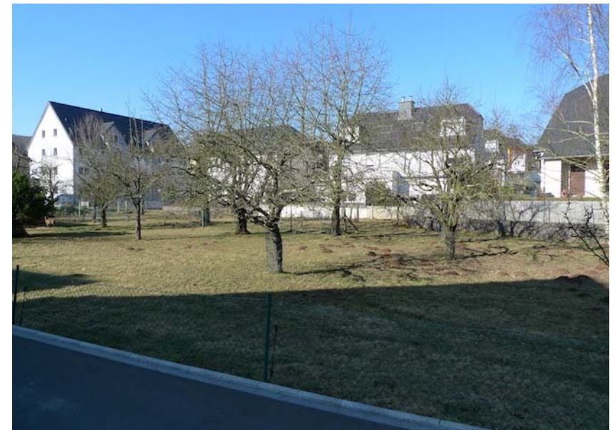
(3) In zweiter Reihe der Porte des Ardennes eine Obstwiese