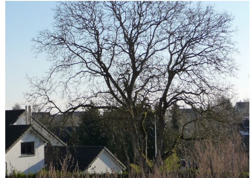
Ein großer geschützter Laubbaum steht an der Grundstücksgrenze