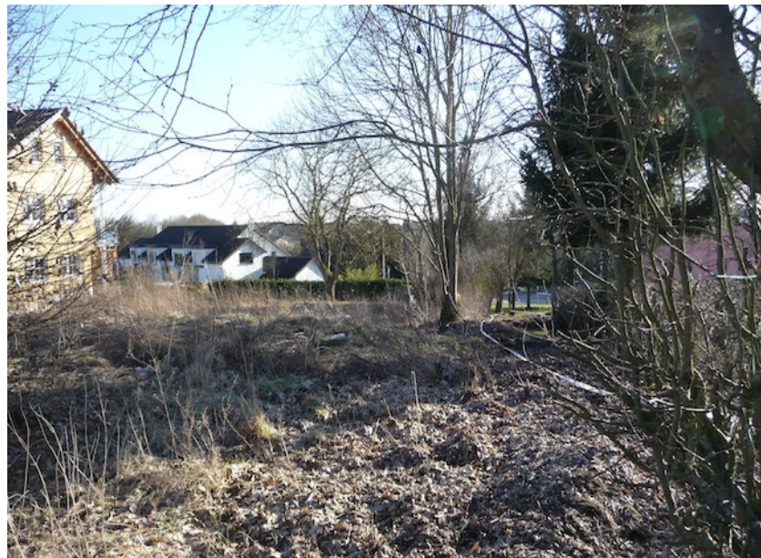
(2) Eine Hecke begrenzt die Fläche im Westen