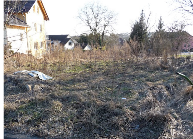
(1) Blick nach Süden brachliegendes Land